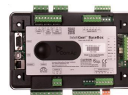
ComAp IntelliGen BaseBox