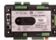
ComAp IntelliGen BaseBox