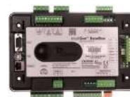
ComAp IntelliGen BaseBox