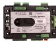
ComAp IntelliGen BaseBox