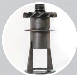
Указатель направления воздуха (D)