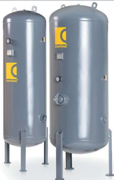
На фотографии слева направо RV-500, RV-900